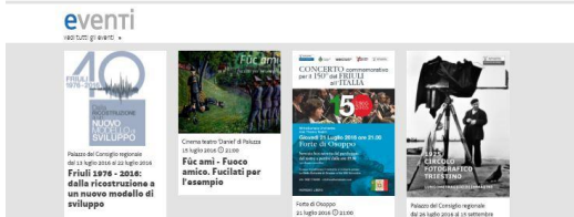
La nuova home page