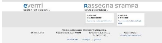
La pagina del Presidente