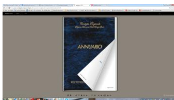
La nuova versione dell'annuario