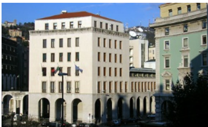
Palazzo del Consiglio regionale sito in Piazza Oberdan 6, Trieste

Secondo quanto stabilito dall'articolo 121 della Costituzione e dall'articolo 24 dello Statuto speciale della Regione autonoma Friuli Venezia Giulia (legge costituzionale n. 1/1963), il Consiglio regionale , quale massimo organo rappresentativo della comunità regionale, esercita le potestà legislative attribuite alla Regione e le altre funzioni conferitegli dalla Costituzione, dallo Statuto speciale e dalle leggi dello Stato.